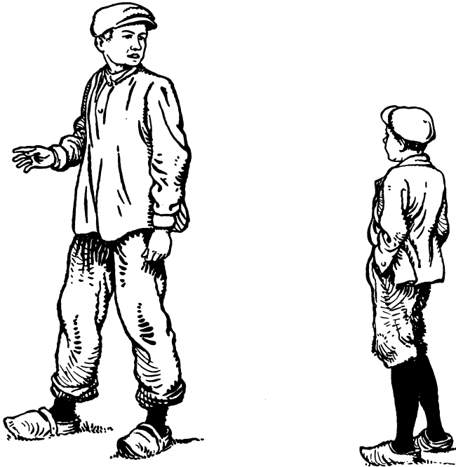
Een eindje voorbij de boerderij ontmoetten beiden elkaar.

De schuur stond open — was er iemand in? Dirk spande z'n ogen in, om in de verste hoeken te speuren: niets te zien. Vooruit nu! Hij liep langs het tuintje,