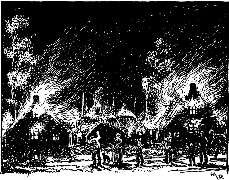
Rood en vurig bruisten de wilde vlammen.

sputten, die met hun enkele stralen vruchteloos stonden tegen de geweldige brand. De burgemeester had naar de stad geseind om hulp — die kwam ook wel, maar toen had de brand al een grote omvang aangenomen — een ramp was het geworden . . . .