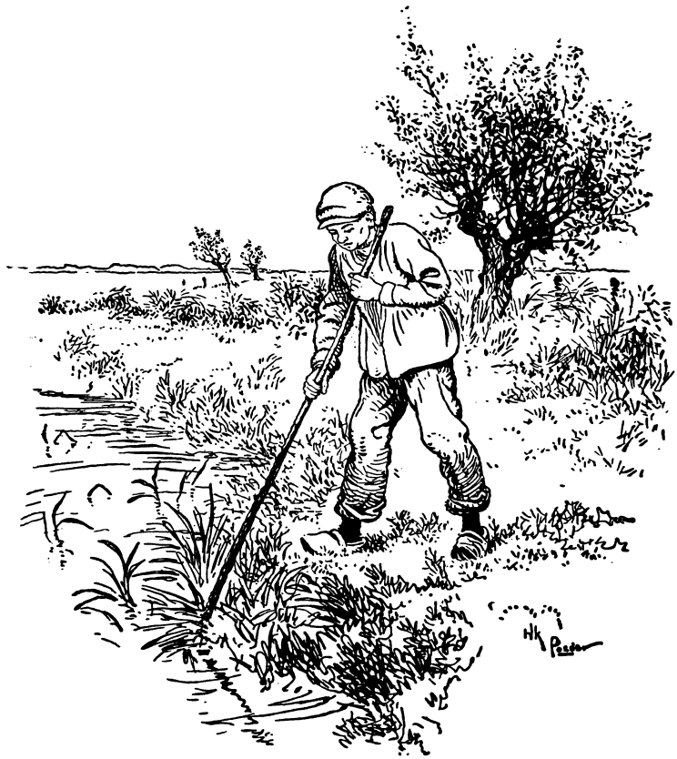
SCHOONMAKEN VAN DE SLOTEN.