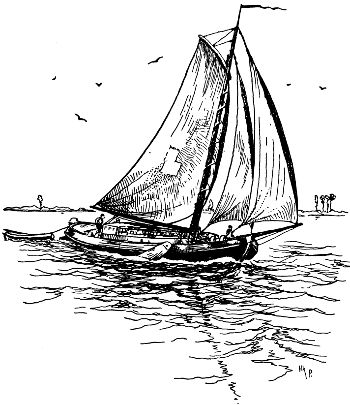
Een hooggeladen zeilschip kwam voor de wind.

Bij het inspannen hadden ze vol belangstelling toegekeken. De boer had een aardig geschilderd wagentje, waar wel ruimte in was voor vijf personen. Er vóór