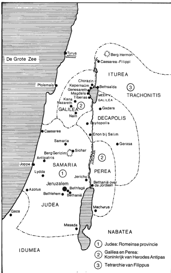
Israël in de tijd van het Nieuwe Testament