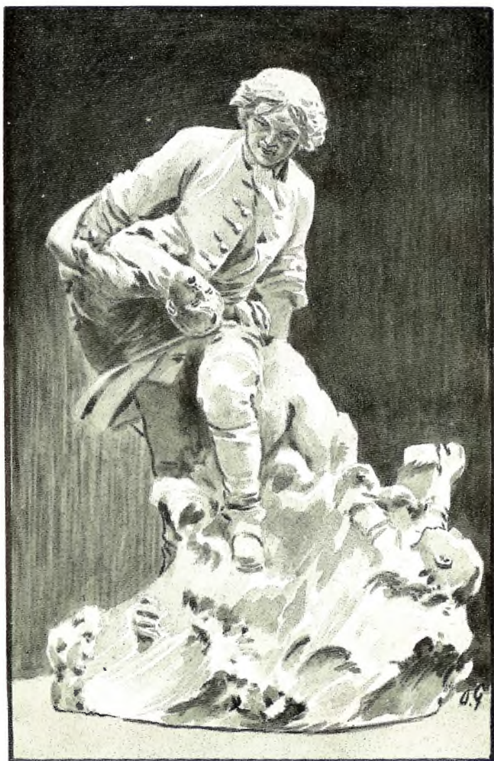
STANDBEELD VAN TSAAR PETER DEN GROOTE TE ST. PETERSBURG hem voorstellende als redder van schipbrékelingen te Kronstadt in 1721