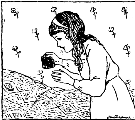
NAM HET IN DE HAND.

Al haar drift en verongelijkt-zijn was weg. Ze