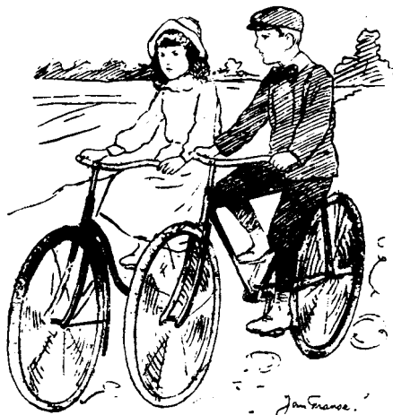
DAAR REDEN ZE NU.

Maar telkens als hij naar Mientje keek, zag hij haar norsch en zuur gezicht. En dan vond hij 't toch