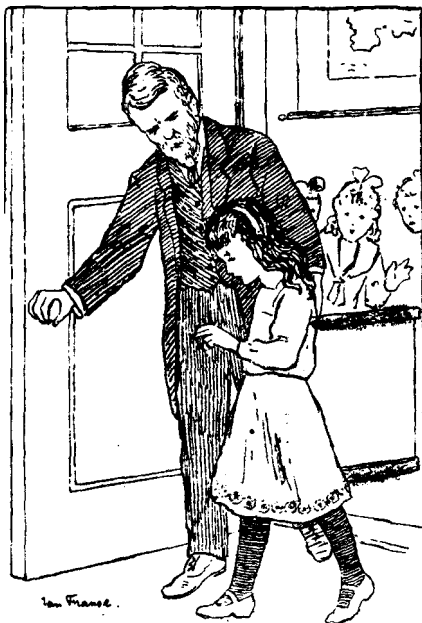
VOELDE ZE ZICH BIJ DEN ARM GEGREPEN.

echter geen woord over wat er dien morgen gebeurd was. Alleen, ze vond het bepaald verdrietig, scheen hij heelemaal geen notitie van haar te nemen. Ze had het gevoel, dat hij over haar heen keek, of ze lucht was. Zoo gauw haar gedachten maar even afdwaalden, scheen hij