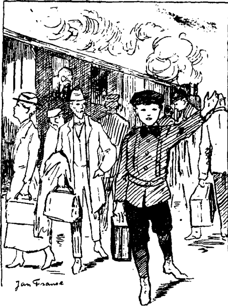
EINDELIJK KWAM HIJ.

Eindelijk kwam hij. Hij droeg een donkerblauw pak, met een band over den rug en veel zakken met knoopjes er op. Uit de korte broek kwamen zijn stevige beenen. Hij droeg zwarte kousen. En op zijn lang blond haar droeg hij een donker grijze pet. In zijn linkerhand torste hij een grooten bruin-