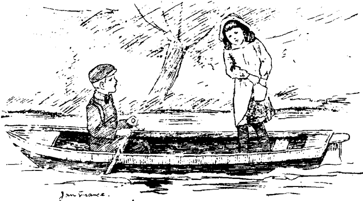
NU IS MIJN BEURSE WEG.

„O, zeg, nu is mijn beursje weg. Weet je ook waar 't is misschien?”