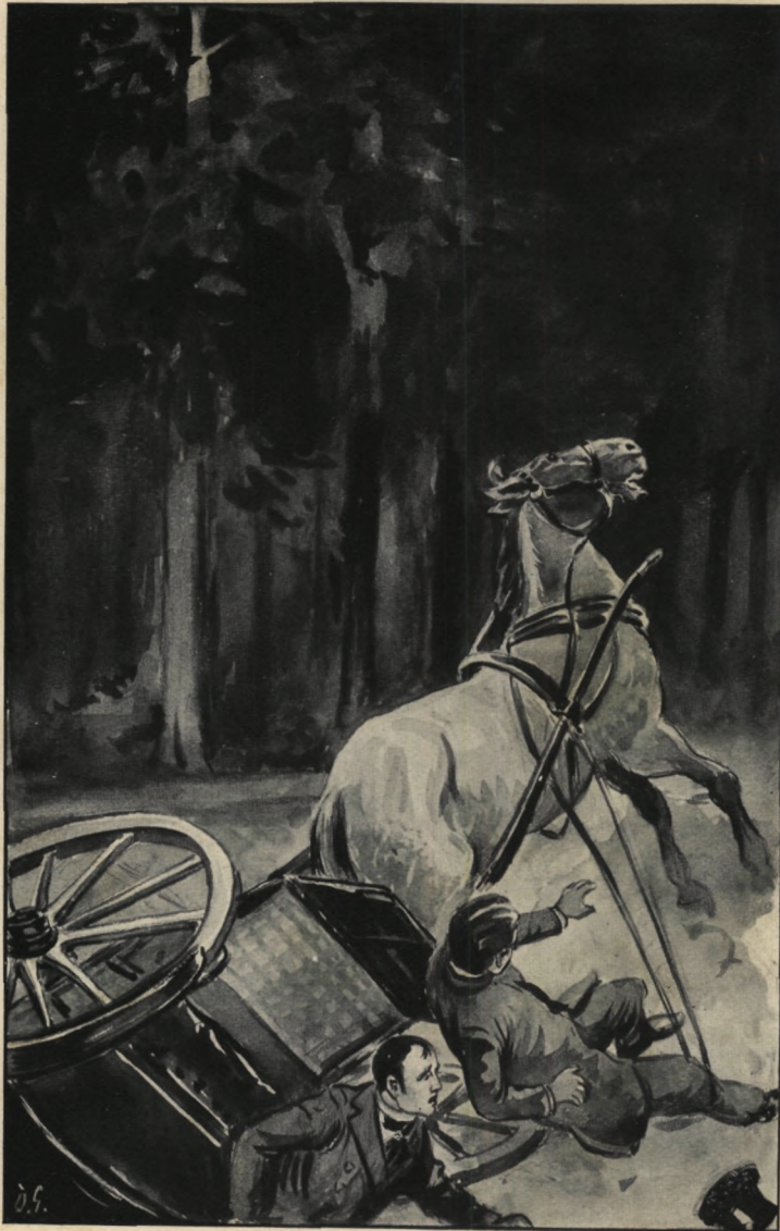
Het eene wiel sprong uit de as en .... bons! daar zakte het rijtuig ineen .... blz. 75