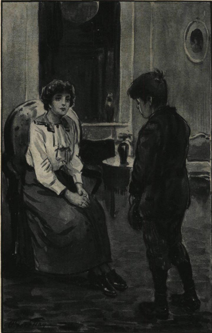
Zij onderhield zich nu met den knaap, die telkens uit verlegenheid de pet tusschen zijn vingers ronddraaide . . . blz. 29