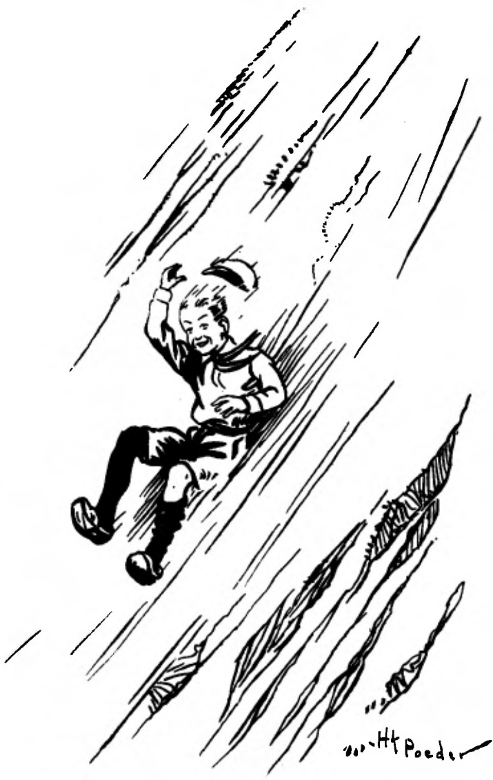
.... en roets, daar schoot hij naar beneden.