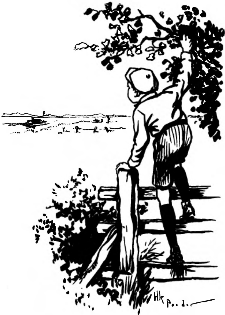
Hij krom nog iets hooger op het hek.