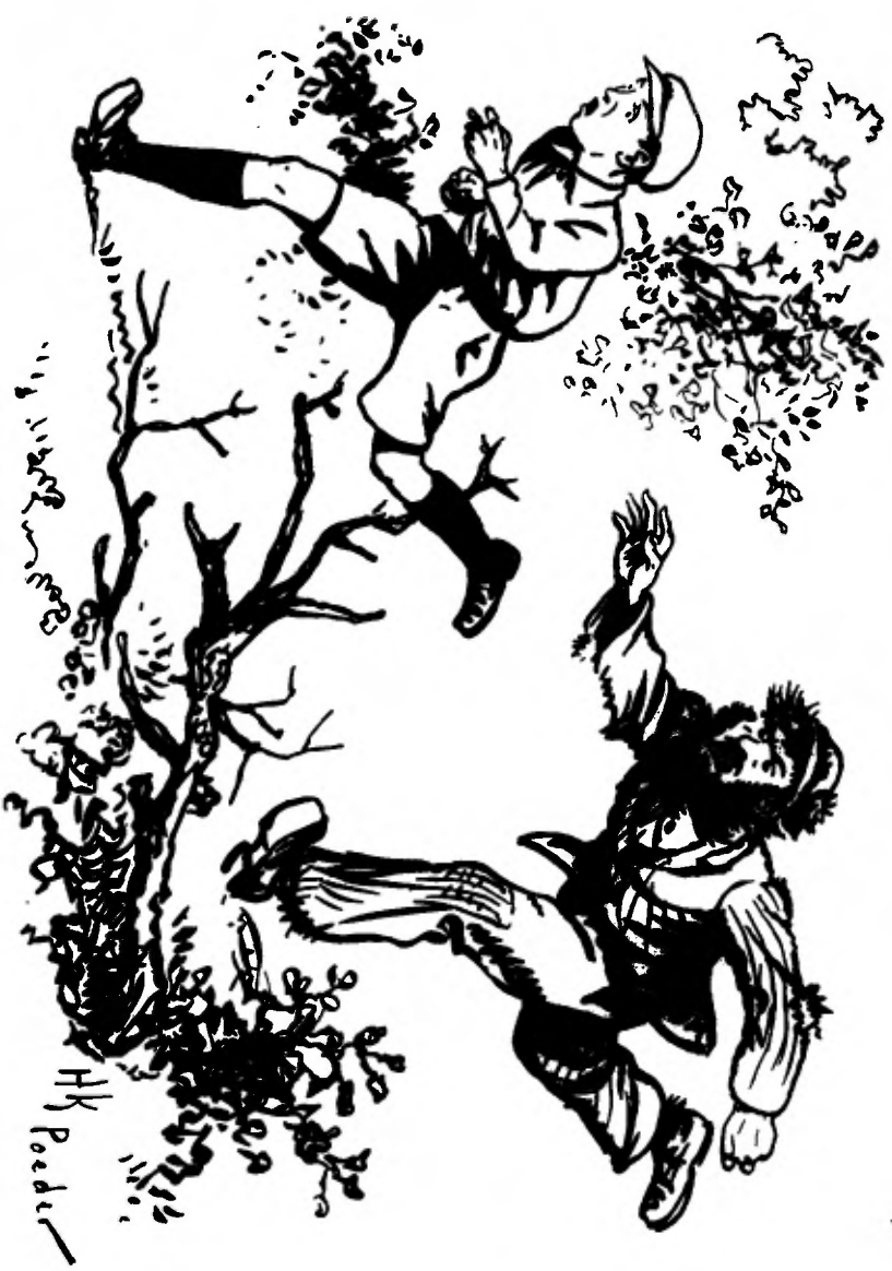
„Wacht maurr!“ brulde hij, „wacht maar, Hierr!“