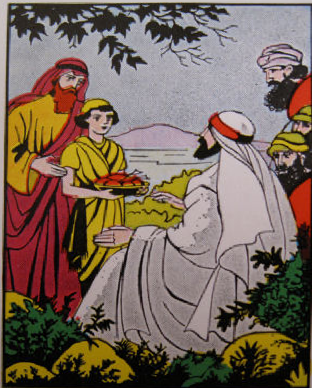
19 Spijziging van de vijfduizend Een jongen brengt vijf broden en twee vissen, waarmee Jezus de menigte spijzigt. Mattheüs 14 : 13—21