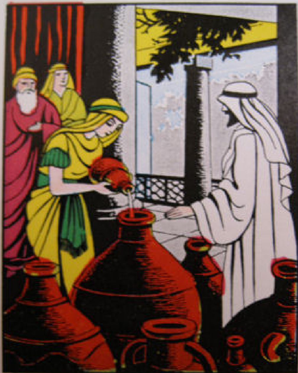
9 De bruiloft te Kana Jezus laat de stenen kruiken met water vullen en verandert dat in wijn. Johannes 2 : 1—11