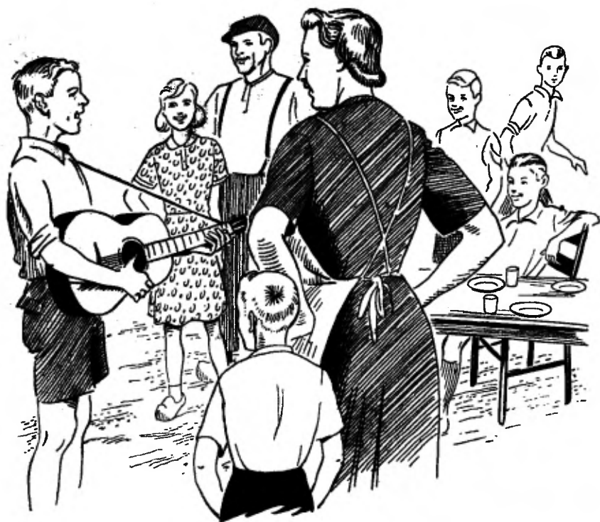
Tekeningen van Rein Stuurman