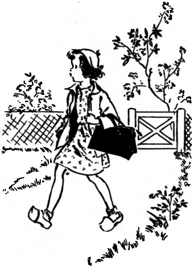
Ze floot als een kwajongen.

lege azijnfles en een fles met een restje petroleum meenam.