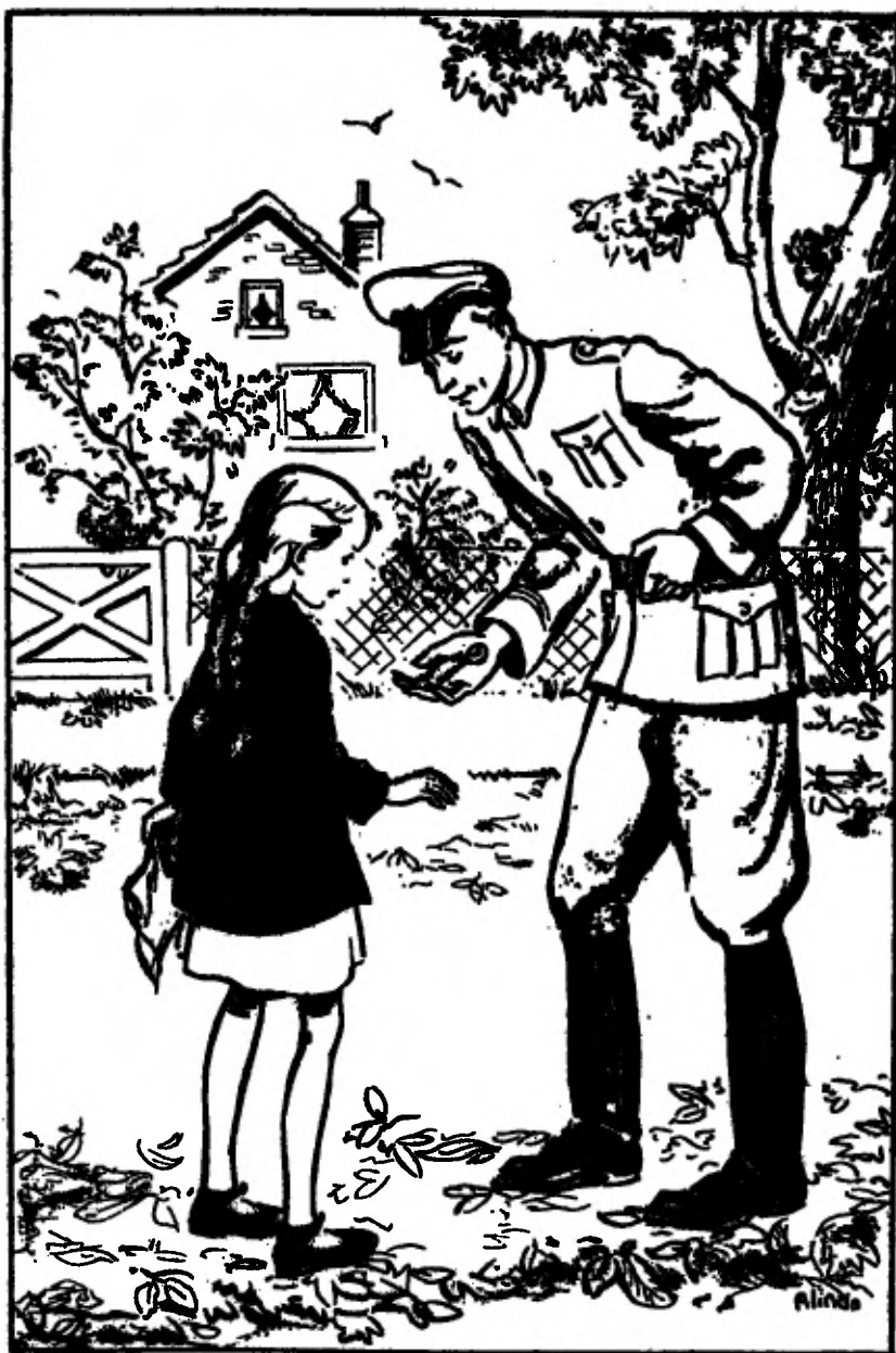
Ineens lag op de geopende soldatenhand glimmend en fijn... het koninginlepelkje (Zie blz. 39).